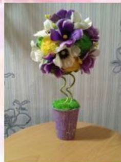
Топиариз учащихся ую «Калейдоскоп идей», «Про-декор» МАОУДОД ЦДТ «Хибины» г. Кировска