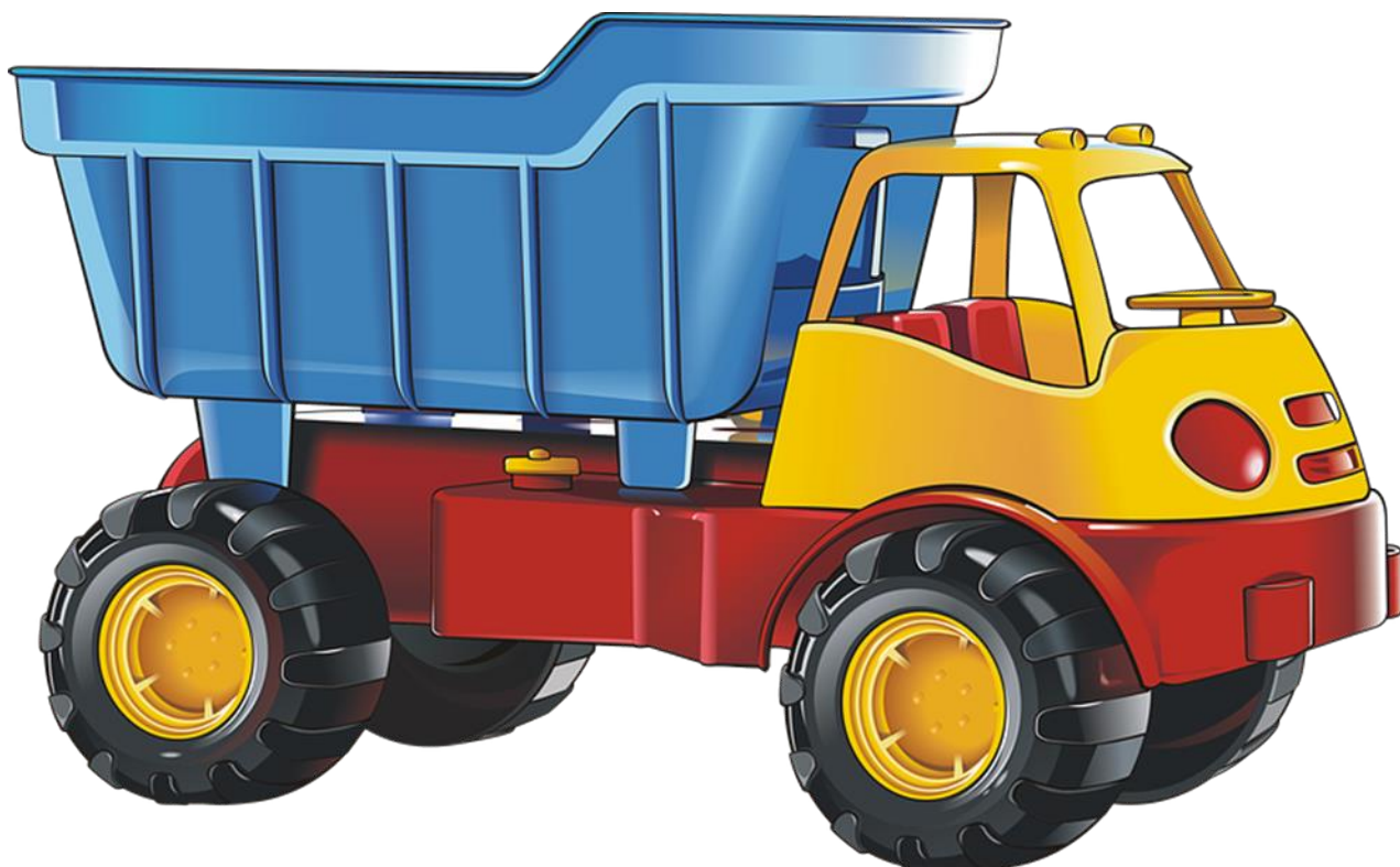
Рисунок 1. – Грузовичок

Звучит весёлая музыка, путешествие ребят заканчивается, и они возвращаются в группу.