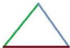
Рис. 2. Иллюстрация к задаче 4

4. Написать в среде Scratch программу, изображающую следующую фигуру (рис. 2).