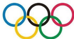
Рис. 3. Иллюстрация к задаче 5

5. Написать в среде Scratch программу, изображающую символику «Олимпийские кольца» (рис. 3).